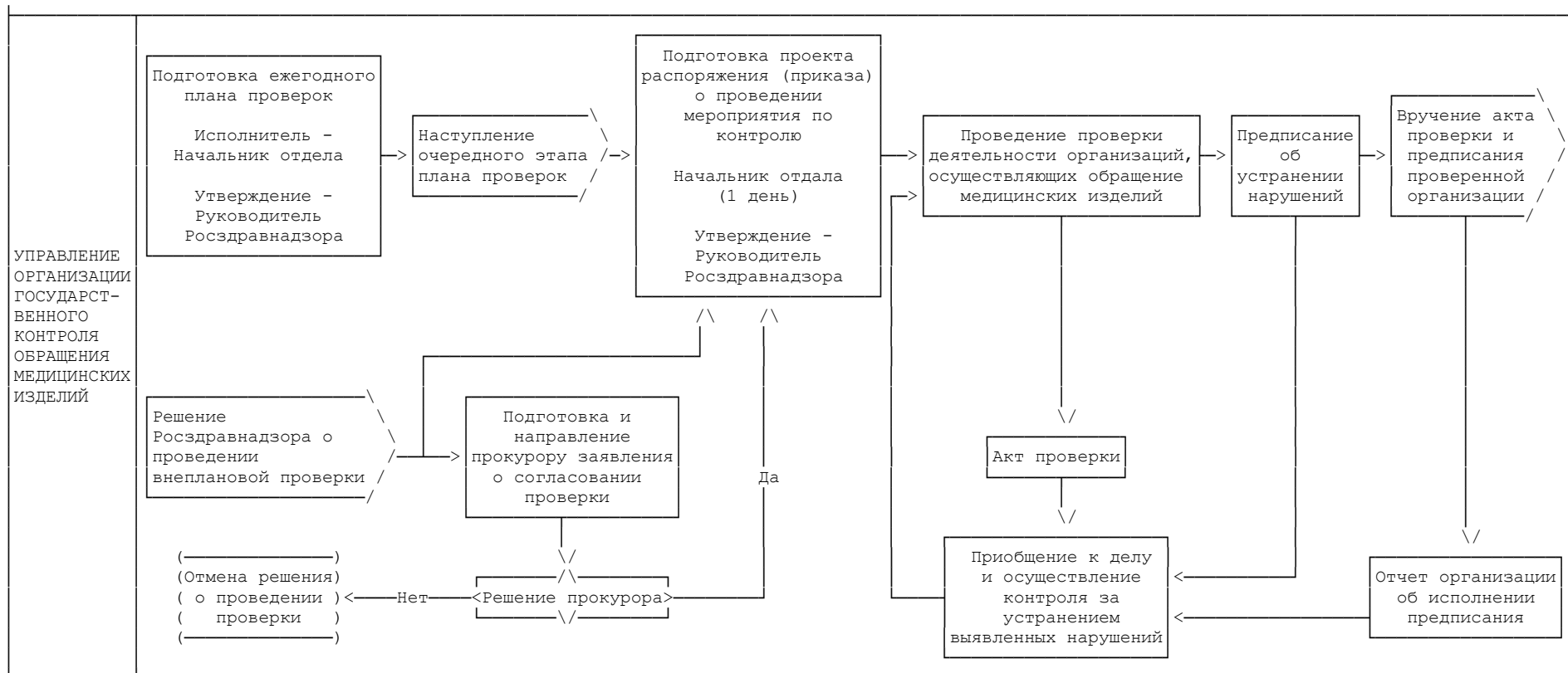
Приложение N 4 к Административному регламенту Федеральной службы по надзору в сфере здравоохранения по исполнению государственной функции по контролю за обращением